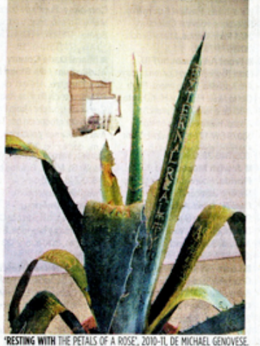
PLANTA DE AGAVE AZUL GRABADA CON FRASES Y FIBERGLASS.

'Escape the Room', hasta el 28 de febrero en Farside Gallery, 1305 Galloway Road (87th Avenue), Miami, FL 33174. (305) 264-3355.