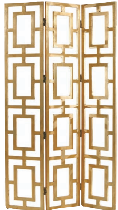
เรื่อง: สุพิชชา ไตรวิชัยกุล, ใจรัก ถนนพหลโยธิน